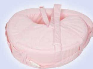
Nido rosa cuadrados