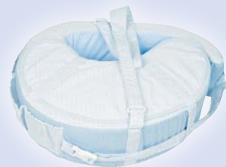
Nido azul cuadrados